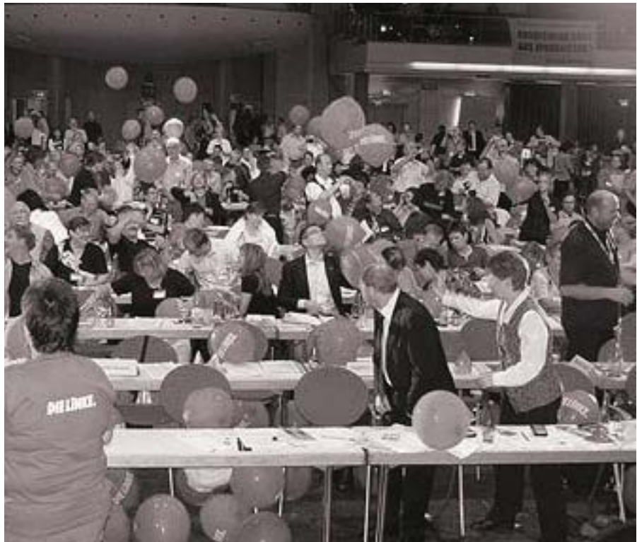
Der Jubel auf dem Gründungsparteitag der LINKEN: Antrieb für die erfolgreiche Mitgliederwerbekampagne der LINKEN Köln

– mehr und besser ausgestattete Gemeinschaftsschulen, gezielte Förderung von Kindern mit Migrationshintergrund und Wiederabschaffung der Studiengebühren als erste Schritte dahin.