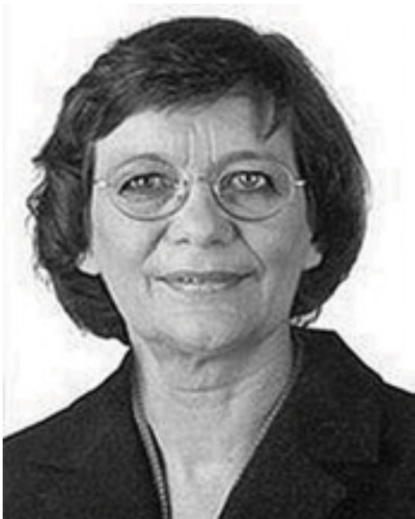
Ulla Lötzer, unsere Kölner Abgeordnete

sche Kriterien einbeziehen. In die europäische Vergaberichtlinie wurde daraufhin aufgenommen, dass soziale und ökologische Kriterien bei öffentlichen Aufträgen vorge-schrieben werden können. Einige Bundesländer haben entsprechende Vergabegesetze beschlossen.