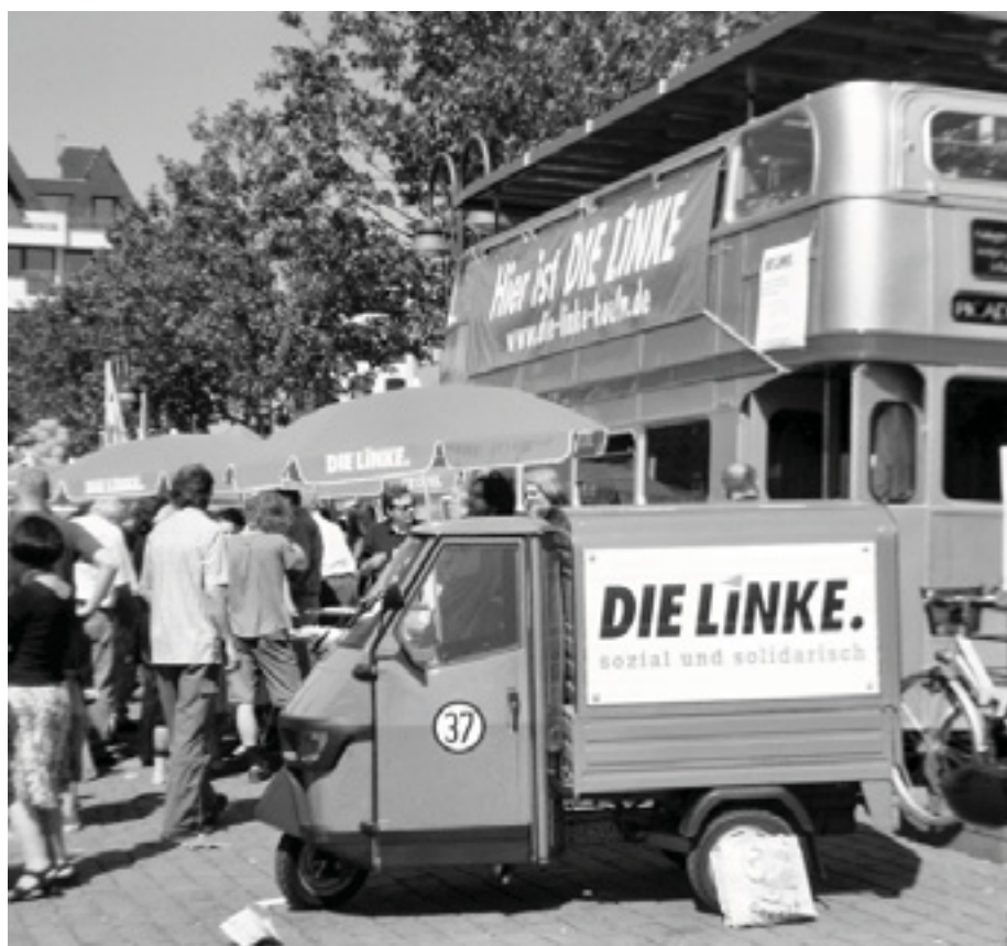
DIE LINKE Köln: aktiv im Einsatz für soziale Gerechtigkeit!