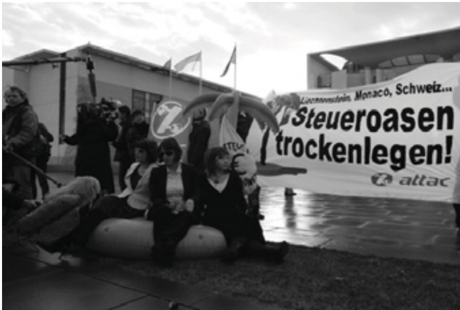
Attac-Aktion zur Schließung von Steuroasen, unter anderem jener in Liechtenstein, Foto: mediastarter/CreativeCommons BY SA 2.0 DE